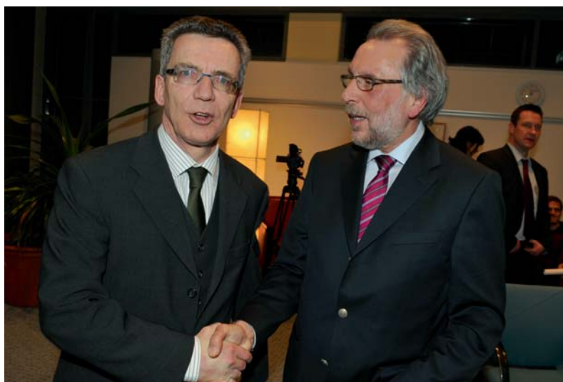
Bundesinnenminister Thomas de Maizière und dbb-Verhandlungsführer Frank Stöhr nach dem Abschluss der Tarifverhandlungen

Die Ausbildungs- und Praktikantenentgelte werden entsprechend erhöht. Zusätzlich erhalten Azubis und Praktikanten im Januar 2011 eine Sonderzahlung von 50 Euro. Weiterhin werden die Garantiebeträge bei Höhergruppierungen rückwirkend ab Januar 2010 erhöht. Für Höhergruppierungen ab dem 1. Januar 2010 wird der Garantiebetrug nach § 17 Abs. 4 TVöD in den Entgeltgruppen 1 bis 8 von 30 auf 50 Euro angehoben. Für Höhergruppierungen in den Entgeltgruppen 9 bis 15 beträgt der Garantiebetrug statt bisher 60 Euro nunmehr 80 Euro.